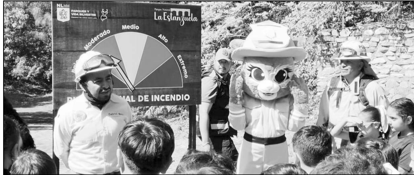
Ante el riesgo de incendios forestales que existe en la entidad se busca promover la cultura de prevención