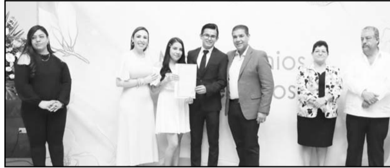
El alcalde, Francisco Treviño, dijo que seguirán con las bodas colectivas

En este sentido, señaló que después de la aprobación, trabajarán en el mecanismo de distribución de los recursos, que se le brindarán a quienes tengan negocios en los sectores afectados, no a los dueños de los locales.(ATT)