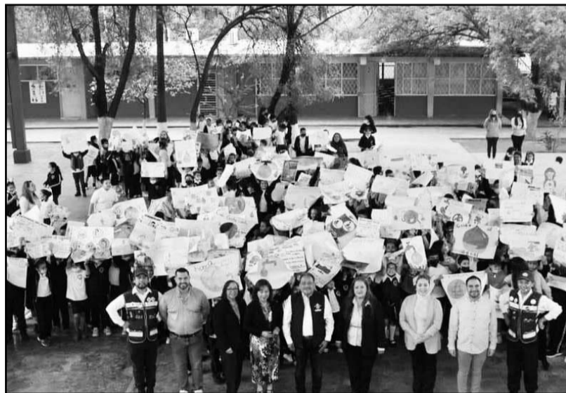
Un total de 300 estudiantes integran el grupo

mente puedan practicarlas en sus hogares. En el inicio de la campaña a los alumnos se les relató un cuento llamado “Los guardianes del agua”, el cual trata sobre la problemática actual del recurso natural y qué es lo que se debe hacer para su permanencia. El Edil otorgó la insignia a las y los estudiantes que participaron en un concurso de dibujo donde plasmaron la manera en que pueden ayudar a cuidar el vital líquido y dar soluciones a la problemática. “Ayúdenos a transferir este conocimiento de cultura del agua a sus papás, abuelitos, amigos, para que podamos tener siempre este vital líquido a disposición”, dijo. Además, encabezó la toma de protesta a las y los niños del plantel como “Guardianes del agua”.(CLR)