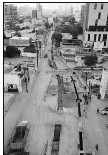
Ayer iniciaron los trabajos

El domingo pasado se dio a conocer que, tras un diálogo con los comer-