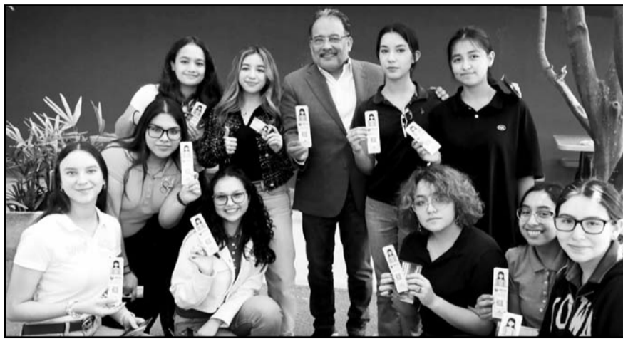
A un año de su creación, se han superado las expectativas

Su función primordial es acercar a todas y todos a los distintos programas de apoyo y atención que forman parte de la Secretaría de la Mujer.(CLR).