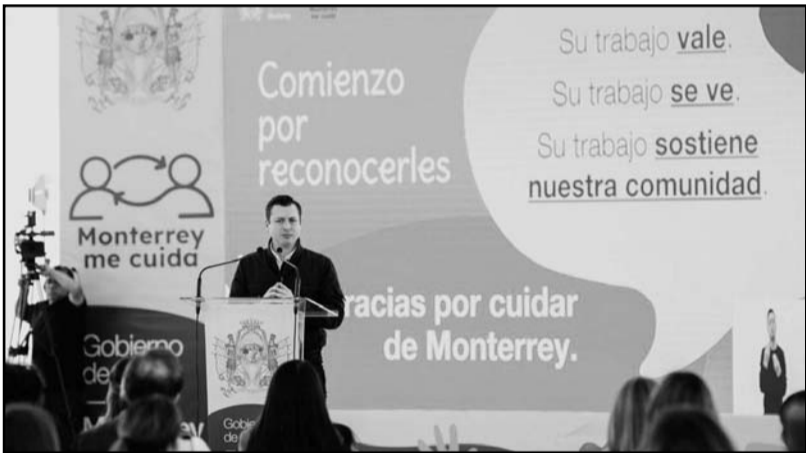
El objetivo es brindar el apoyo a las personas cuidadoras

El ejecutivo municipal manifestó que claramente los tres carriles están funcionando a máxima capacidad, lo que ha generado mayor movilidad, por lo que llevarán el proyecto hasta la clínica 67 del IMSS.(ATT)