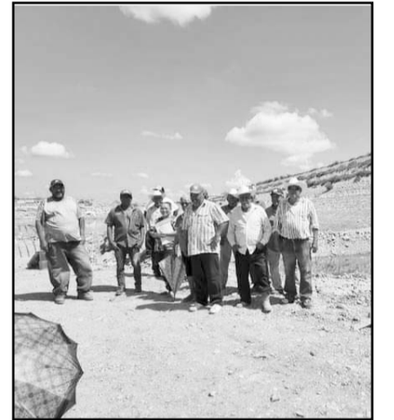
Protestaron de manera pacífica

Y es que los habitantes de las comunidades de Leones, Cerro Prieto y San Isidro demandaron ser escucha-