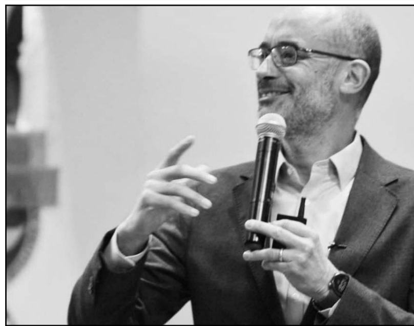
El alcalde pidió que el gobierno mexicano se haga responsable