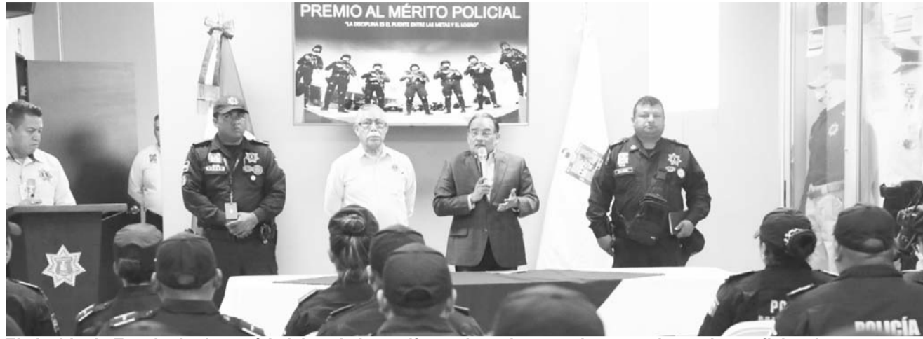
El alcalde de Escobedo destacó la labor de los uniformados y los premio por su honradez y eficiencia

El Premio al Mérito Policial se entrega cada bimestre a elementos que participaron en acciones excepcionales o relevantes como el aseguramiento de armas, drogas o vehículos, así como en