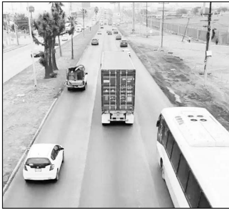
Realizó un recorrido desde el Arco Vial al Boulevard del Aeropuerto

"Todas las personas, así como merecemos y requerimos cuidados, también merecemos oportunidades y libertad plena para poder realizar todo nuestro potencial", agregó. (JMD)