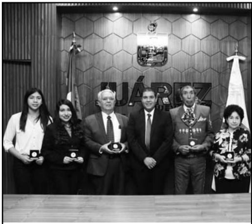
La recibieron cinco ciudadanos

Al hablar sobre el Benemérito de las Américas, Treviño exhortó a la ciudadanía, y en especial a los jóvenes, a preservar su legado.(IGB)