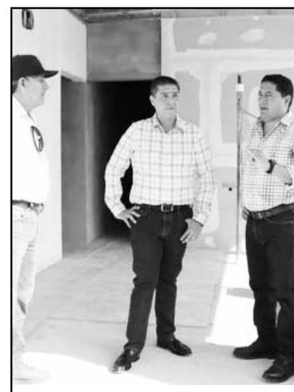
Es una delegación de Policía