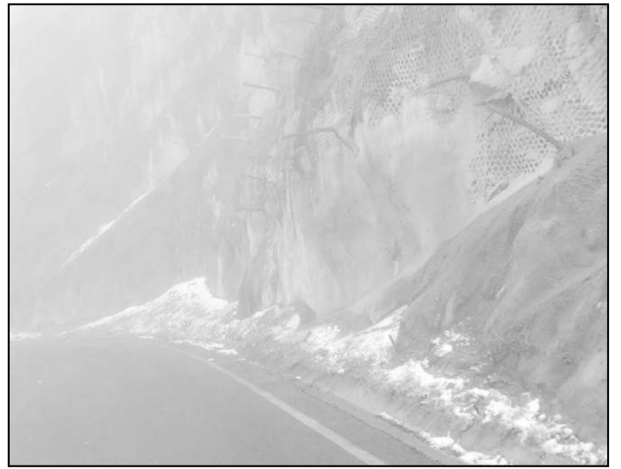
Durante la madrugada de ayer se registraron hasta cero grados

Durante esta madrugada se espera que el termómetro baje aún más los registros, particularmente en las zonas de sierra como Santiago, Rayones, Iturbide y Galeana.(JMD)